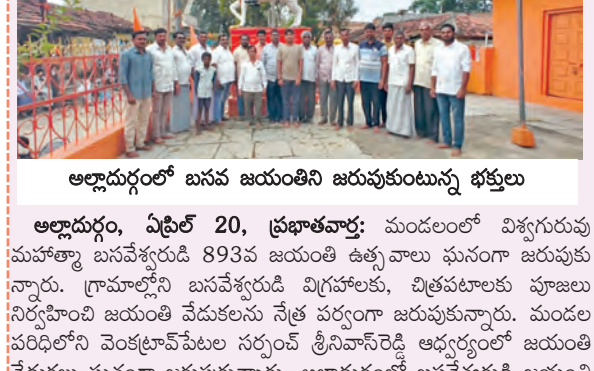
అల్లూరుగల్లో బసవ జయంతిని జరుపుకుంటున్న భక్తులు