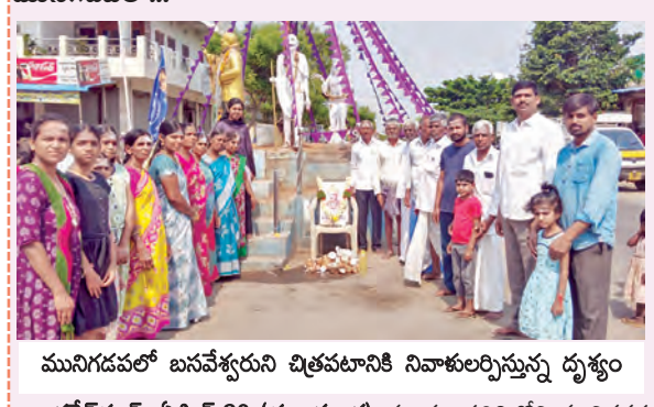
మునిగడపలో బసవేశ్వరుని చిత్రపటానికి నివాళులర్పిస్తున్న దృశ్యం