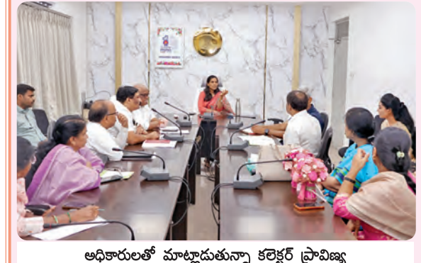
అధికారులతో మాట్లాడుతున్న కలెక్టర్ ప్రతిమాసింగ్