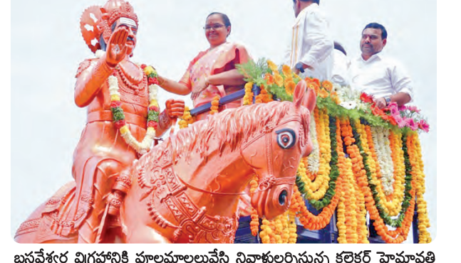
బసవేశ్వర విగ్రహానికి పూలమాలవేసి నివాళులర్పిస్తున్న కలెక్టర్ హైమావతి