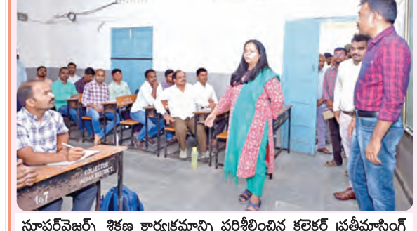
సూపర్వైజర్లు శిక్షణ కార్యక్రమాన్ని పరిశీలించిన కలెక్టర్ ప్రతిమాసింగ్