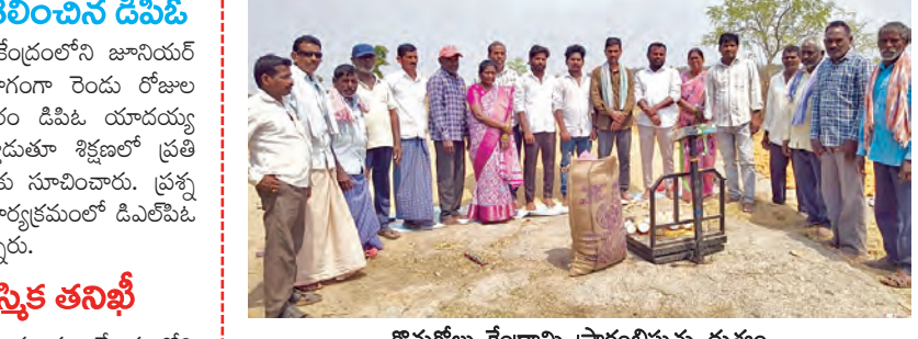
కొనుగోలు కేంద్రాన్ని ప్రారంభిస్తున్న దృశ్యం