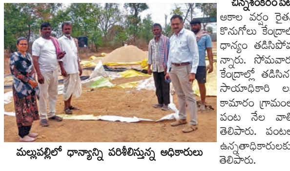
మల్లుపల్లిలో ధాన్యాన్ని పరిశీలిస్తున్న అధికారులు