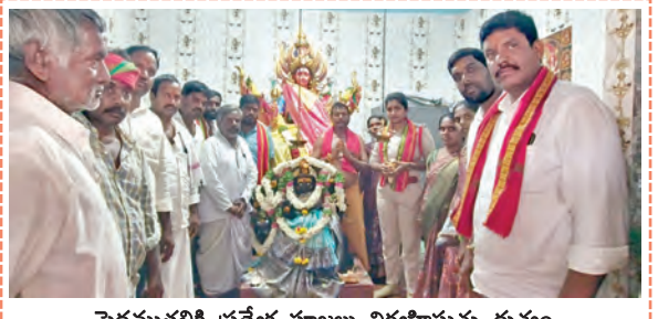
వైభవంతో ప్రత్యేక పూజలు నిర్వహిస్తున్న దృశ్యం