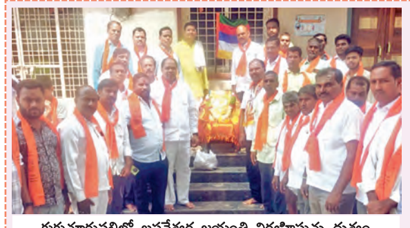
కుకునూరుపల్లిలో బసవేశ్వర జయంతి నిర్వహిస్తున్న దృశ్యం