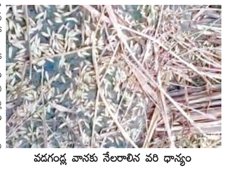
వడండ్ల వానకు నేలరాలిన పరి ధాన్యం

వెల్దురి, ఏప్రిల్ 20, ప్రభాతవార్త : మండలంలో ఆదివారం రాత్రి భారీ వర్షం కురవడంతో ధాన్యం, మామిడికాయలు నేల రాలిపోయాయి. మండలంలోని శశిరెడ్డిపల్లి తండా, చర్లపల్లి తండాలో ధాన్యం నేలరాలడంతో రైతులు ఆవేదన వ్యక్తం చేశారు. ప్రభుత్వం తడిసిన ధాన్యాన్ని కొనుగోలు చేయాలని రైతులు కోరుతున్నారు. అలాగే మామిడి చెట్ల నేలరాలడంతో నష్టం జరిగిందని, ప్రభుత్వం తమకు నష్టపరిహారం అందించాలని కోరారు. తమకు ఆర్థిక సాయం అందించాలని రైతులు ఆదివారం కోరారు.